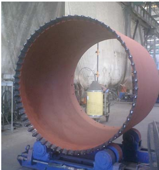
ベノト掘削用ファースチューブ (φ 1500 mm)