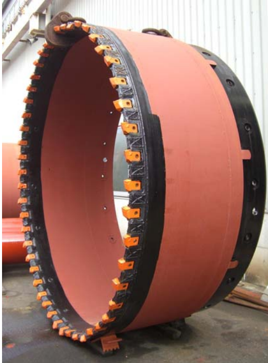
全周回転用ファースチューブ (φ 2500 mm)