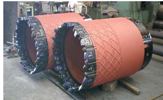
全周回用ファースチューブ (φ 1000 mm)